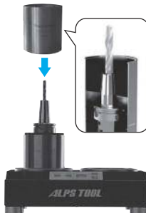
冷却ファン装置 ISGK2002 Cool Station ISGK2002