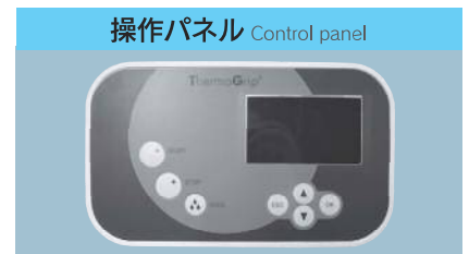
操作パネル Control panel

メニュー選択の簡単操作。 パラメータ設定変更で特殊形状の焼きバメチャックにも対応。 Easy to operate. Changeable the parameter set up.