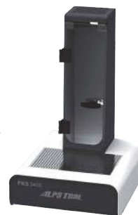
水冷装置 FKS3400MZ Water Chiller Unit FKS3400MZ